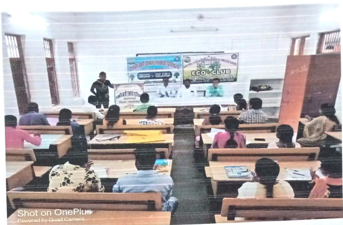
Shot on OnePlus Powered by Quad Camera