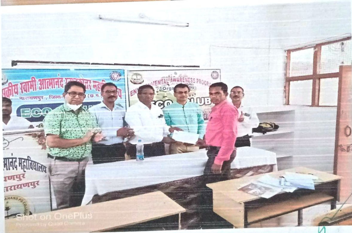
Shot on OnePlus Powered by Quad Camera