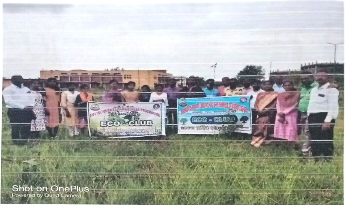
Shot on OnePlus Powered by Quad Camera